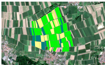
FIGURE 2 – Exemple de données réelles à traiter, issues du Registre Parcellaire Graphique de 2015.

L'objectif final est de construire une chaîne de traitement incluant l'ensemble des opérations sur les données d'un domaine.